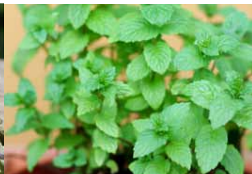
mięta poprawia pracę jelit i działa brzeciwbakteryjnie

składników, jak witaminy, minerały, aminokwasy, enzymy.