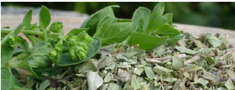
oregano przydatne w walce z przeziębieniem i stanami zapalnymi

Opierają się na doświadczeniach na ludziach i innych niż konie zwierzętach, a po zastosowaniu u ruma-ków mogą być nieodpowiednie i niebezpieczne. Ważne jest również, by nie ulec naturalnej magii „zielonych” specyfików. Wiele osób wciąż uważa, że tylko to, co pochodzi z zielonej rośliny, jest naturalne i dobre, a to, co z pudełka suplementu – sztuczne i gorsze. Niesłusznie, ponieważ większość suplementów uznanych producentów bazuje na naturalnych składnikach. Z roślin pochodzą też niektóre leki, np. kora wierzby jest źródłem kwasu salicylowego – podstawowego składnika aspiryny. Naturalne nie zawsze też znaczy bezpieczne! Bukszpan, cis czy jałowiec są silnie toksyczne, ich pobranie może spowo-