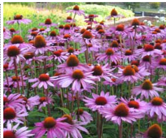
jeżówka (echinacea) doskonała we wspieraniu ogólnej odporności organizmu

Z ioła od zawsze są obecne w żywieniu koni. Zwierzęta od wieków same wybierały korzenie, liście czy kwiaty, które pomagały uzupełnić ich dietę o cenne substancje aktywne wpływające na metabolizm i odporność oraz pomocne w zwalczaniu różnych dolegliwości. Wykorzystanie wybranych ziół w stajennym jadłospisie służy w profilaktyce zdrowia i pomaga w leczeniu farmakologicznym niektórych schorzeń. Zioła zawierają substancje biologicznie czynne, które wywierają charakterystyczny wpływ na organizm. Wśród tych